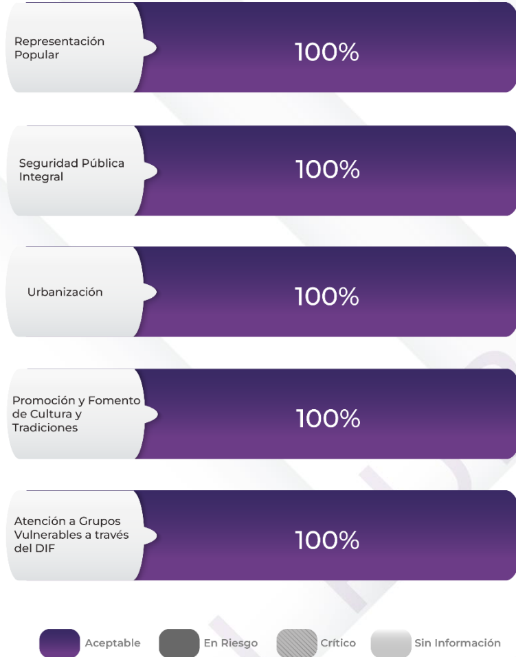
Gráfico 2. Comportamiento de los indicadores de los Pp